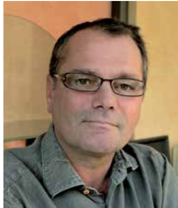
— Denis Mougel LES VÉRANDAS DU GOLF

Créée en 1989 à Ormesson-sur-Marne (Val-de-Marne), la société Les Vèrandas du Golf rayonne sur le sud-est de la région Île-de-France. Elle réalise chaque année environ 70 vérandas sur un segment de marché moyen-haut de gamme insensible à la crise.