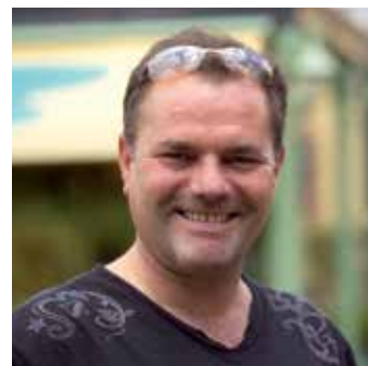
— Denis Mougel LES VÉRANDAS DU GOLF

En pratique, le massage à l'eau chaude met en œuvre une batterie de buses judicieusement disposées au fond et sur les parois de la coque, ainsi que dans les sièges. Ces buses d'ouverture variable génèrent les jets et tourbillons qui mettent l'eau en mouvement autour du corps. Un système complémentaire, dénommé "blower", injecte des bulles d'air qui démultiplient les effets du massage. L'efficacité de l'hydrothérapie ne dépend pas forcément du nombre de buses installées mais plutôt de leur type et de leur emplacement. Les buses les plus sophistiquées sont orientables, interchangeables ou même rotatives. Le panneau de commande du spa doit permettre de régler facilement la pression et le débit des jets, tandis que l'ergonomie des sièges doit être conçue pour soutenir parfaitement le corps, que ce soit en position assise ou allongée dans le siège couchette.